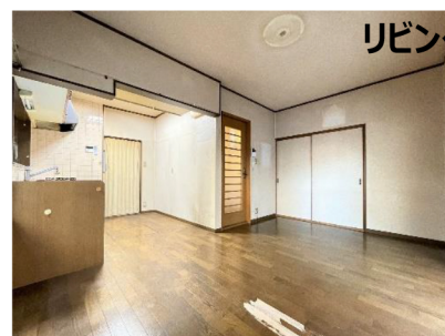
リビング現況写真