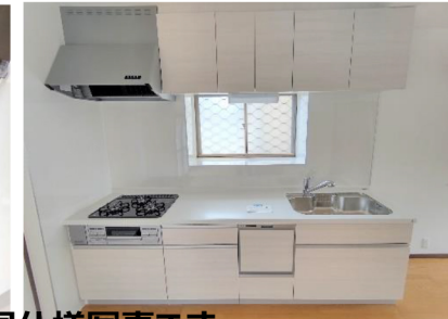
水回りは同仕様写真です