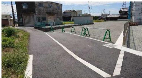
友沢分譲地価格表