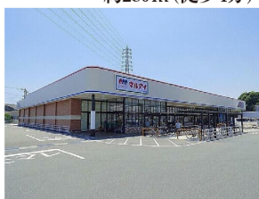
■マルアイ米田店 ……約640m(徒歩8分)