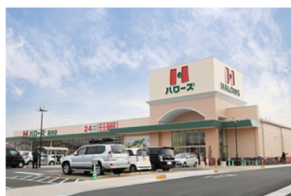
■ハローズ高砂店 ……約280m(徒歩4分)