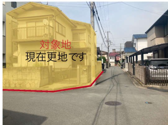
対象地 現在更地です

※机上分筆後の確認測定を行った結果、差異が生じる場合がございます。※図面と現状が異なる場合は現状を優先させていただきます。※広告掲載中に完売済みとなる場合がありますので、ご了承ください。※車・バスの所要時間はインターネットサイトを参照しており、実際に異なる場合がございます。※客付会社様へ、ご案内の際は必ず事前にご連絡をお願いいたします。※水道加入金は、別途買主負担となります。※登記手続きを行う土地家屋調査士および司法書士は売主の指定となります。詳細については担当までお問い合わせください。