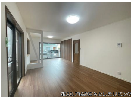
約20.7帖の広々としたリビング