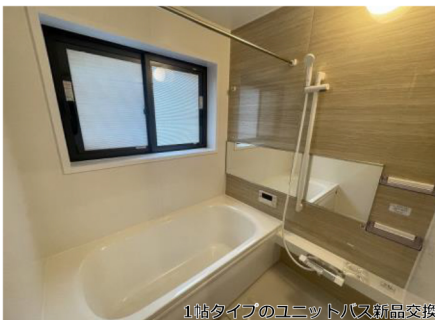
1帖タイプのユニットバス新品交換