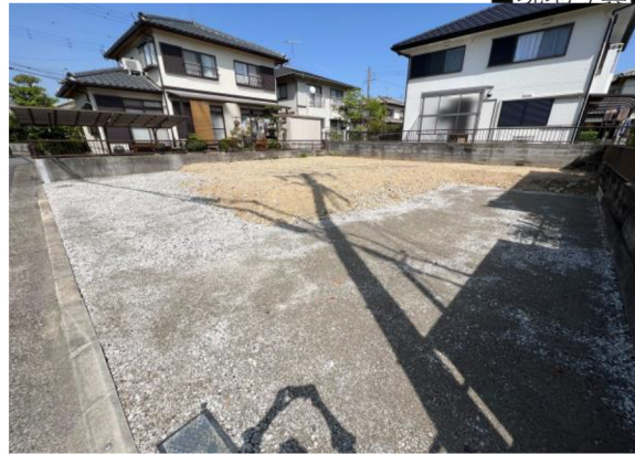
■ 現地写真 ■