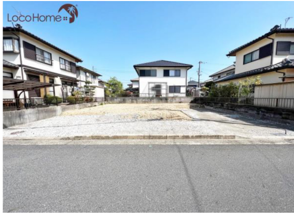
■ 現地写真 ■